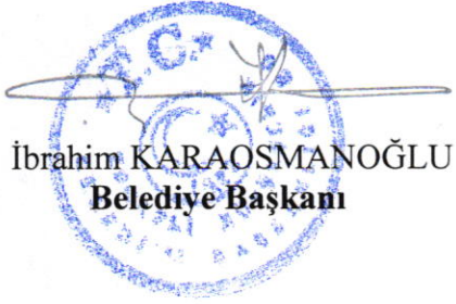
İbrahim KARAOSMANOĞLU Belediye Başkanı